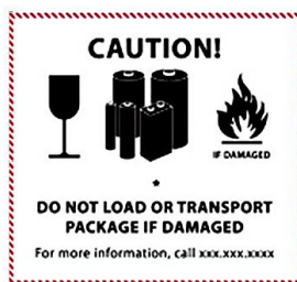
Bisheriges Kennzeichen mit Übergangsfrist bis 31. Dez. 2018